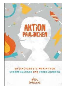
Plakat, Flyer, Postkarte (Motiv Superhelden)