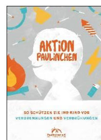
Plakat, Flyer, Postkarte (Motiv Superhelden)