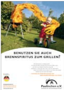
6. Plakat „Grillen deutsch“