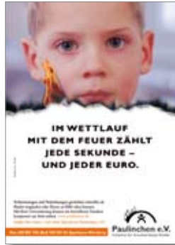
3. Plakat „Junge“