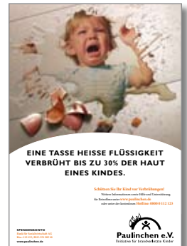
10. Plakat „Verbrühung“