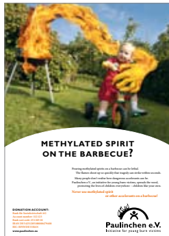
7. Plakat „Grillen englisch“