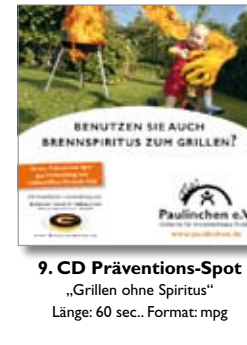
9. CD Präventions-Spot „Grillen ohne Spiritus“ Länge: 60 sec.. Format: mpg