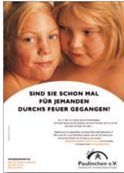
2. Plakat „Mädchen“