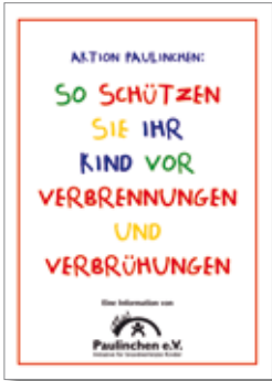
1. Aktion Paulinchen „So schützen Sie Ihr Kind vor Verbrennungen und Verbrühungen“

Folgende Materialien können Sie ganz einfach mit dem Bestellformular auf der nächsten Seite bestellen.