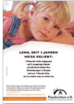
4. Plakat „Lena“