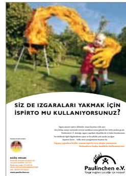
8. Plakat „Grillen türkisch“