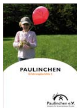
17. Paulinchen - Erfahrungsberichte 2