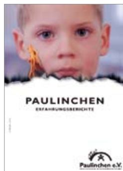
16. Paulinchen - Erfahrungsberichte