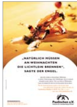
12. Plakat „Engel“