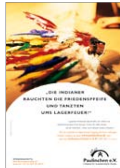
14. Plakat „Indianer“