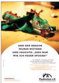
11. Plakat „Drache“