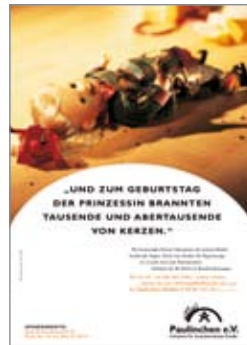
13. Plakat „Puppe“