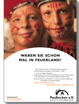
5. Plakat „Feuerland“