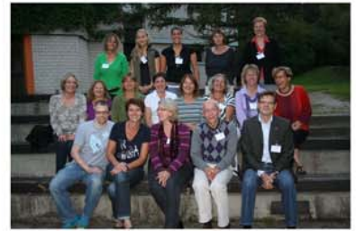
Team 2009: Facharzt für Plastische Chirurgie, Seelsorger, Psychologin, Ergotherapeutin, Krankengymnastin, Kinderkrankenschwester, Spezialistin für Kompression, 7 Heilpädagogen und Erzieher, 2 erwachsene brandverletzte Kinder, 2 Seminarleiter von Paulinchen

Kinder verunglücken in verschiedenen Alterstufen, jedes Entwicklungsstadium lässt unterschiedliche Probleme entstehen. Um den Kindern und Jugendlichen die Möglichkeit zu geben, andere brandverletzte Kinder kennen zu lernen und den Eltern bei Fragen zur Rehabilitation sowie bei langfristigen Korrekturplanungen zu helfen, veranstaltet Paulinchen e.V. seit 1996 jährliche Burn Camps für Familien mit brandverletzten Kindern – die Paulinchen-Seminare. Ein Expertenteam berät und begleitet die Familien.